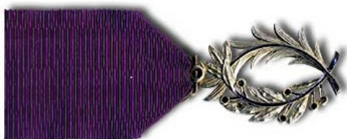
Dyplom i order Palm Akademickich

Po wejściu Polski do Unii Europejskiej kontynuacja wymiany studentów odbywa się w ramach programu ERASMUS i ERASMUS+. Uczestnicy tych programów otrzymują dyplomy uczelni francuskich (Grenoble i Tuluz) i Politechniki Gdańskiej. Obecnie nadawane są nawet podwójne doktoraty uczelni gdańskiej i francuskich (Grenoble i Tuluz).